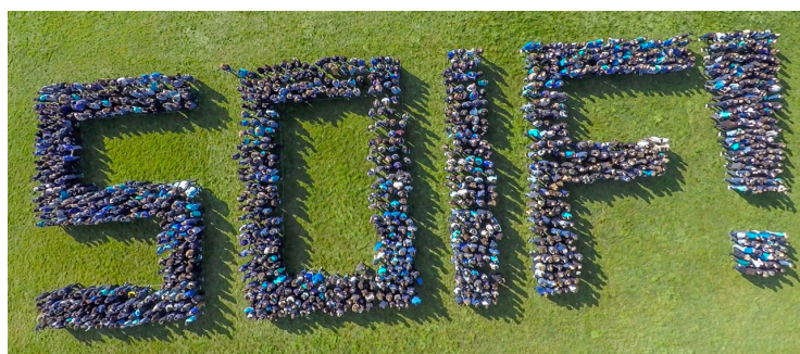
Logo humain «Soif»

Parallèlement à ces projets, plusieurs classes ont réalisé des vidéos sur l'eau dans le cadre du concours du Merleau d'or , vidéos qui se sont vues récompensées par différents prix (les vidéos sont disponibles sur le site APF).